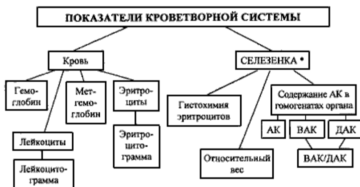
СХЕМА 7. Изучение функционального состояния кроветворной системы.