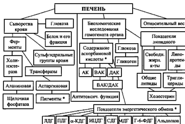
СХЕМА 4. Изучение функционального состояния печени.