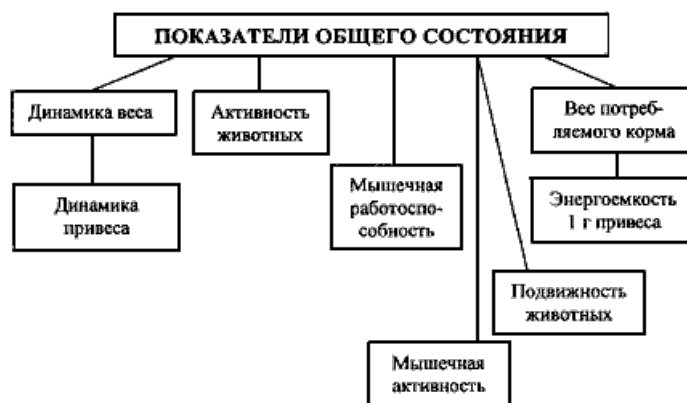
СХЕМА 1. Изучение общего состояния подопытных животных.