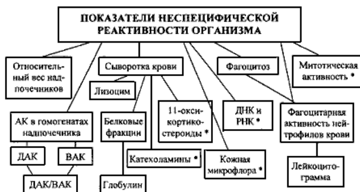
СХЕМА 3. Изучение неспецифической реактивности организма.