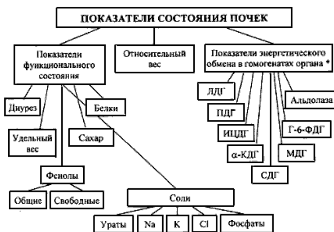
СХЕМА 6. Изучение функционального состояния почек.