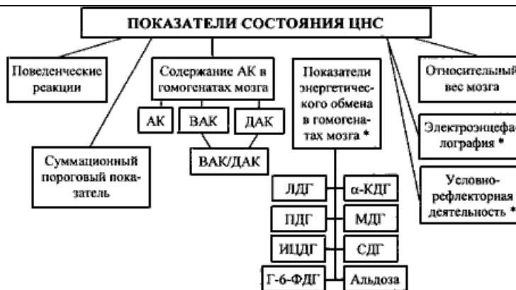
СХЕМА 2. Изучение функционального состояния центральной нервной системы.