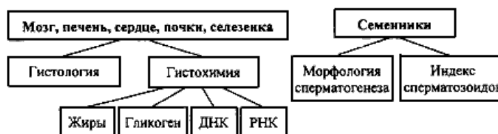
СХЕМА 10. Морфологические исследования органов.

* - тесты, исследования которых не являются обязательными