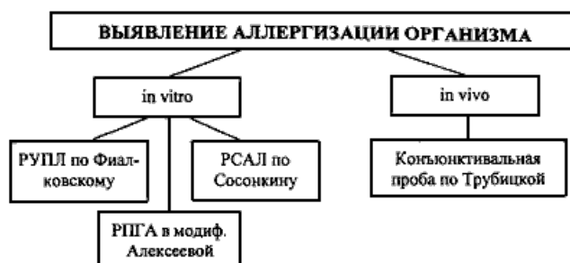
СХЕМА 9. Изучение аллергенной активности.