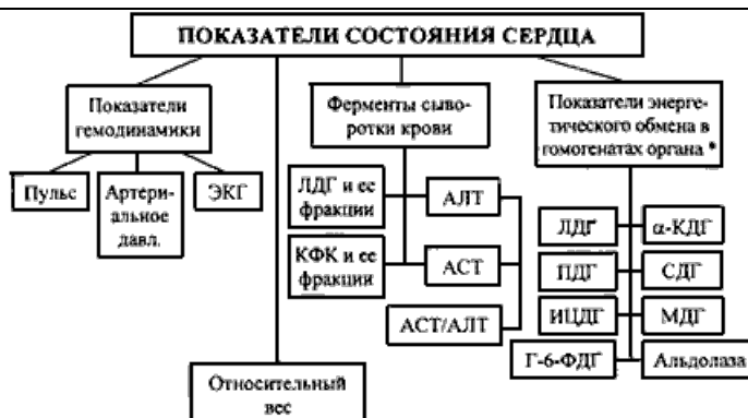
СХЕМА 5. Изучение функционального состояния сердца.